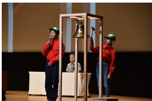
【記念式典】山鐘（山へのメッセージを込めて鳴らす）