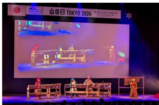
【記念式典】メインアトラクション