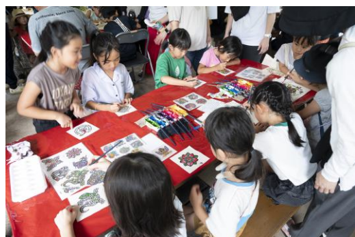
【歓迎フェスティバル】ワークショップ