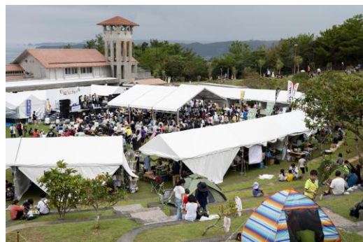
【歓迎フェスティバル】会場の様子