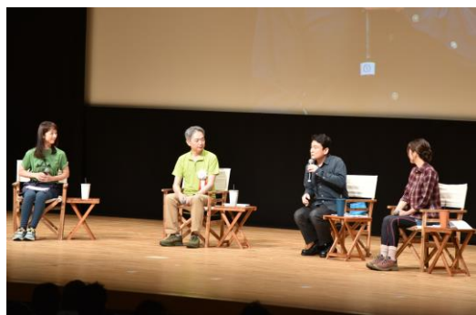
【記念式典】記念行事（トークセッション）