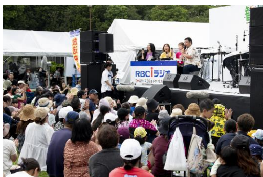
【歓迎フェスティバル】ステージイベント