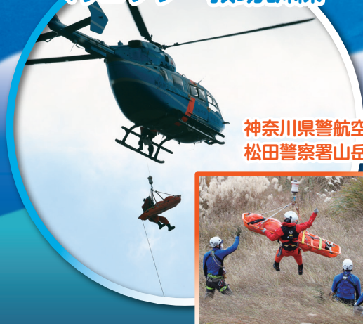
神奈川県警航空隊、 松田警察署山岳救助隊