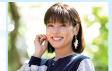
沖縄県出身アーティスト pokke104