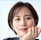
世界自然遺産大使 比嘉 愛未