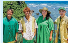
世界自然遺産大使 HY