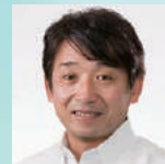
片山 右京 元F1ドライバー 登山家