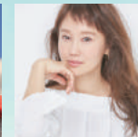
工藤 夕貴 女優