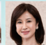
小林 綾子 女優