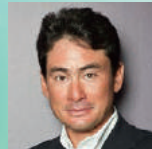
野口 健 アルピニスト