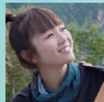
加賀谷 はつみ シンガーソングライター