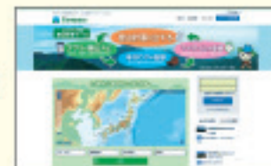
※画面はイメージです。

まずは無料で会員登録。必要事項を記入して、送られてきたメールのURLをクリックするだけです。