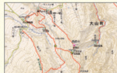
※画面はイメージです。

地図を見ながら目指すルートをクリックしていくだけで、簡単に行動予定が登録できます。