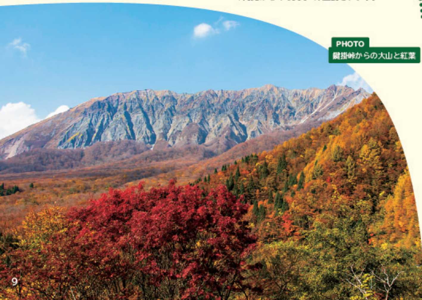
鍵掛峠からの大山と紅葉